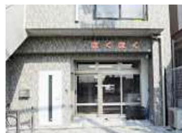
ほくほくのホームページより

昼からは、吹田市万博公園近くのエキスポシティにあるニフレル(NIFREL)へ生き物に会いに行く予定です。