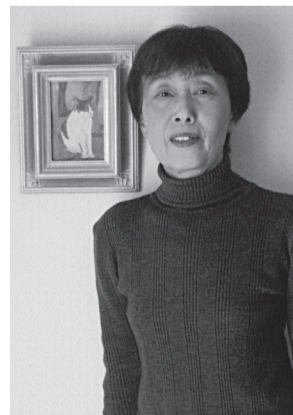
絵画教室に通われており、松原の絵をたくさんの方に描いてもらうという夢をお持ちです。

点訳をすることで、難しい言葉や歴史、地名等を知ることが出来るし、改めて日本語の美しさ奥深さ、意味深さも感じる事ができる。また、点訳サークルを通じて、沢山のひとと出会い、いろいろな勉強もさせていただき自分のためにもなっているし、少しでも視覚障がい者の方々のお役に立てたらと思いこの活動を続けてこられたそうです。