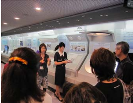
「シャープにてLEDの説明」

6月1日(水)の聴覚障がい者サロン・外出企画はシャープ歴史・技術ホール(天理市)と今井町見学でした。16名が参加しました。