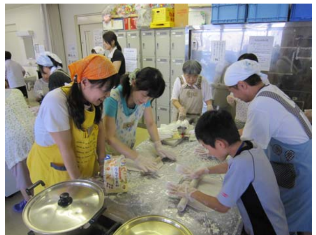
「伸ばすのって難しい~」

さらに班の結束を強めたのが、うどんを寝かせる間に行った「具材争奪戦ゲーム」。 ①大根(おろして後で食べる)、②水を入れたペットボトル、③計量カップのそれぞれの重さを、各自が手に持つなどして推量し、班ごとに数値を発表して、実際の重さに近かった班が好きな具材を選べるというもので、みんな真剣勝負。結果発表のたびに