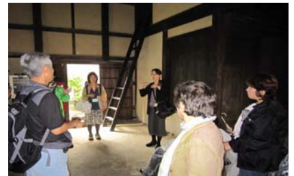
「今井町にて屋敷の説明」

いたので、手話通訳を通して内容がよくわかり、感動した」など感想をいただきました。